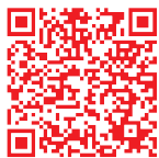
全通事務處理 全省徵求場所查詢